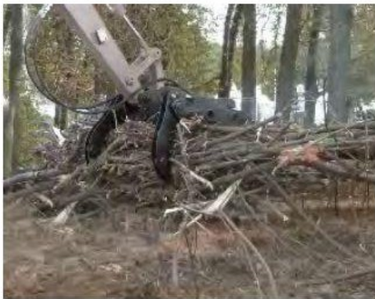
Modèle présenté avec option grappin