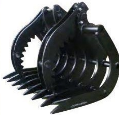
Modèle présenté avec option grappin